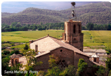
Santa Maria de Ponts

Al final del carrer arribarem a l' església parroquial de Santa Maria de Ponts que és un temple d'origen gòtic i, dins de l'església, esdevé de visita obligada el retaula de la Mare de Déu del Roser (s. XVII) , instal·lat a la capella del Roser, és tracta d'un gran parament, fet en talla de fusta policromada i dedicat a la Mare de Déu del Roser i als Misteris del Rosari.