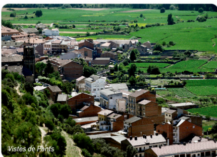
Vistes de Ponts