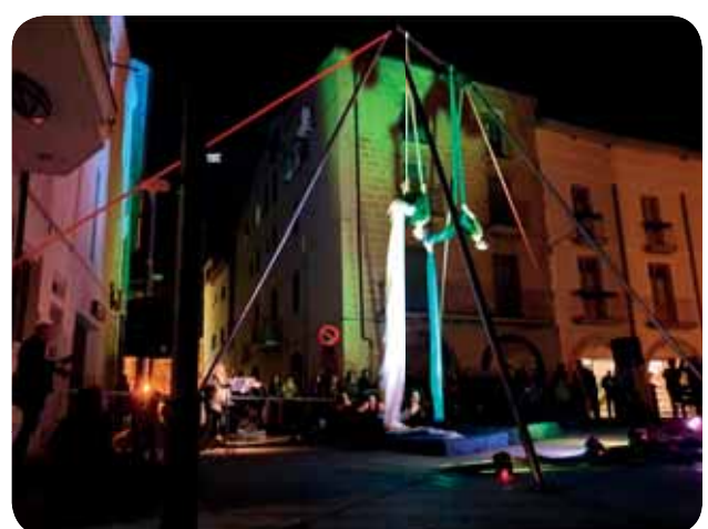
Exposició a Ponts, per les festes del Ranxo.