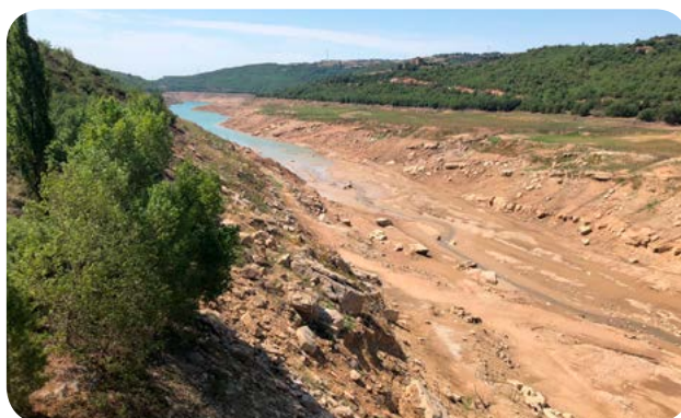
Indret de l'entorn del pont de Polityg, a la Baronia de Rialb