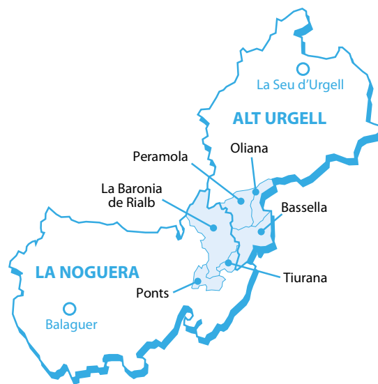
El Segre Rialb