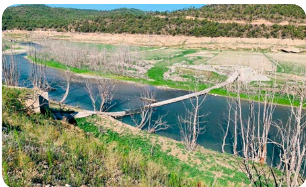
Antic pont entre Bassella i Aguilar.