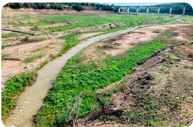
Ribera Salada, amb el pont de la C-14 al fons.