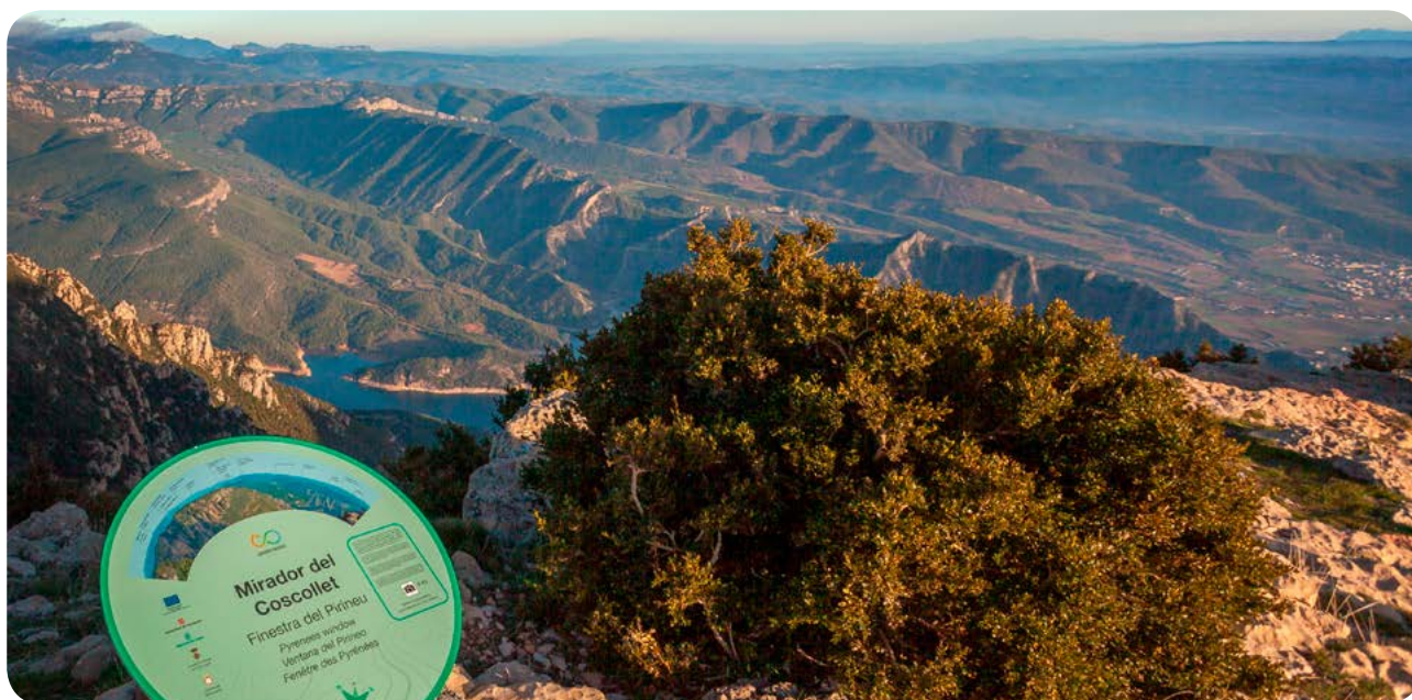
A la foto, el mirador del Coscollet, a Peramola.