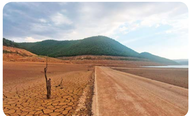
Antiga carretera de Tiurana cap a Andorra.