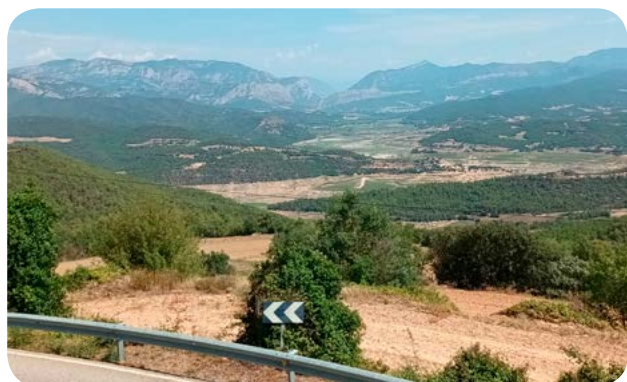
Des de Mirambell, cua del pantà amb el nucli de la Clua.