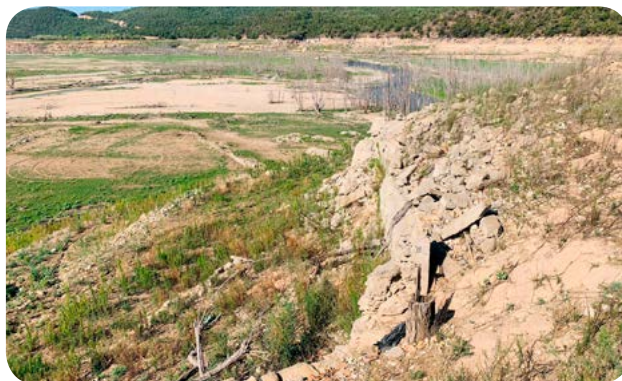
Restes del poble de Bassella. Al fons la confluència Segre i Ribera Salada.