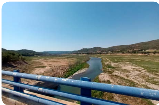
Cua del pantà aigües avall des del pont blau de Peramola.