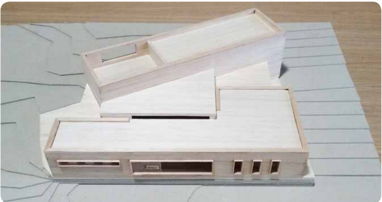
Maqueta nova seu consistorial

En la primera licitació, el setembre de l'any 2018, l'ajuntament va fixar el pressupost del contracte en 299.996 euros i un termini per poder construir l'edifici en sis mesos. Així doncs, la data per poder inaugurar el nou edifici ha viscut un important retard que no permetrà a l'equip de govern disposar d'aquest de cara a les eleccions del proper mes de maig, tal com preveien en un primer moment.