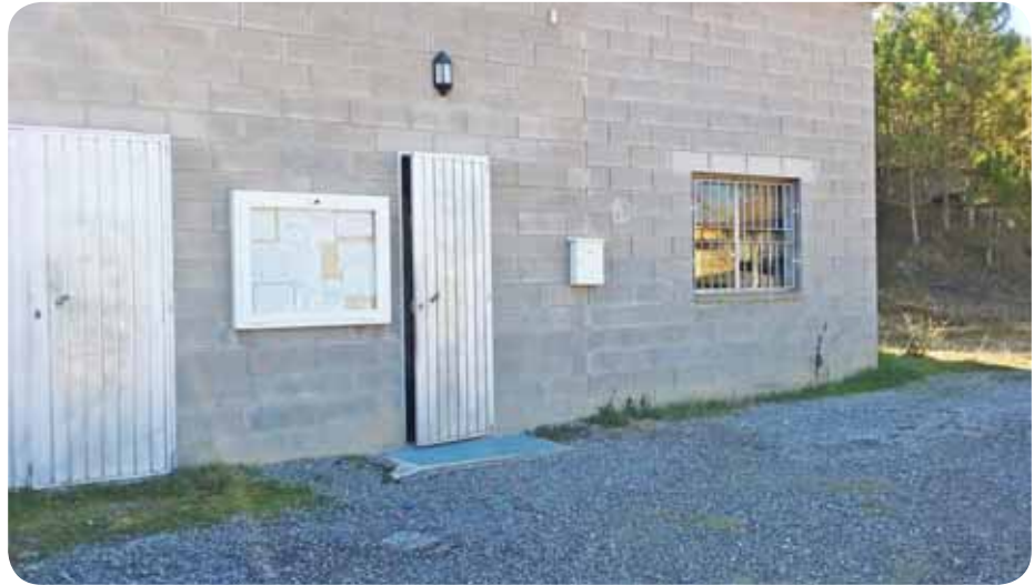
Actual seu consistorial.

La futura seu consistorial, pressupostada en gairebé mig milió d'euros, es preveu que estigui finalitzada en set mesos, amb l'objectiu que entri en funcionament a finals d'any. L'obra, que va a càrrec de la firma d'Oliana Ribalta i Fills, S.A tindrà una superfície d'uns 300 metres quadrats, els quals estaran distribuïts en una sola planta amb l'objectiu de facilitar l'accés a les persones amb mobilitat reduïda.